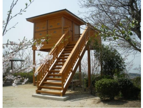
観察小屋対応建築