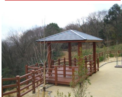
法面对应構造建築