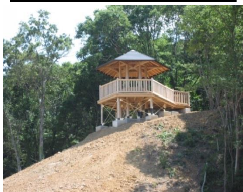
法面对应構造建築