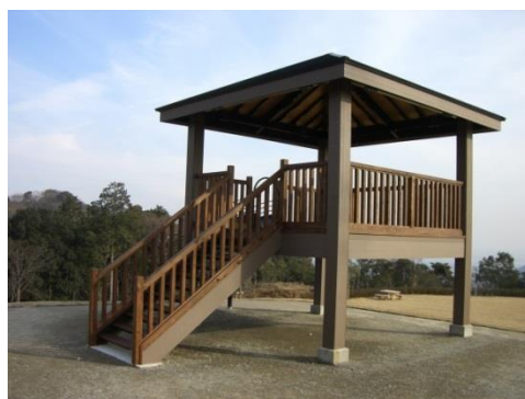
柱・階段部化粧材