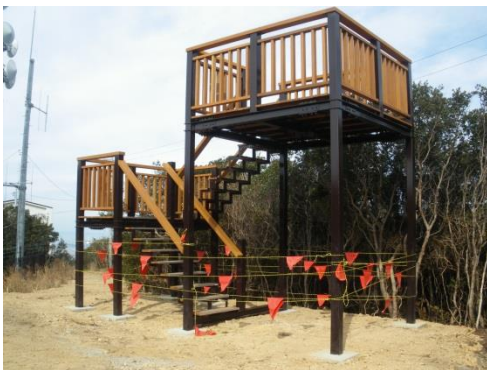
人力組立対応構造建築