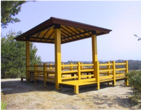
法面对应構造建築