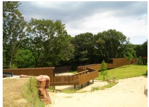
動物園用観察木橋