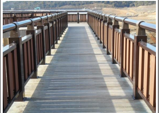
転落防止柵:香蘭型