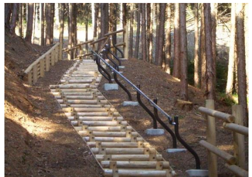
園路幅員確保用柵