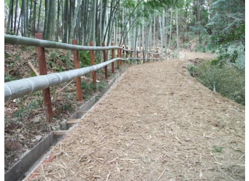
境界柵: 現地発生竹材