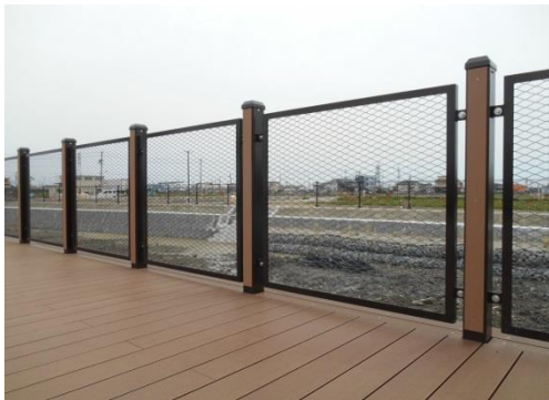
転落防止柵:メッシュ: